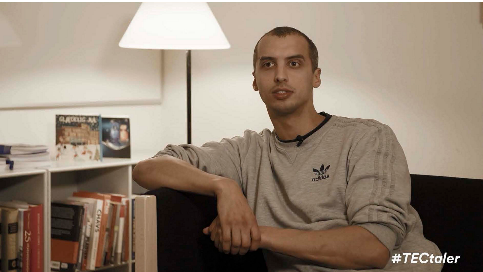
Mattias Tesfaye, Medlem af Folketinget