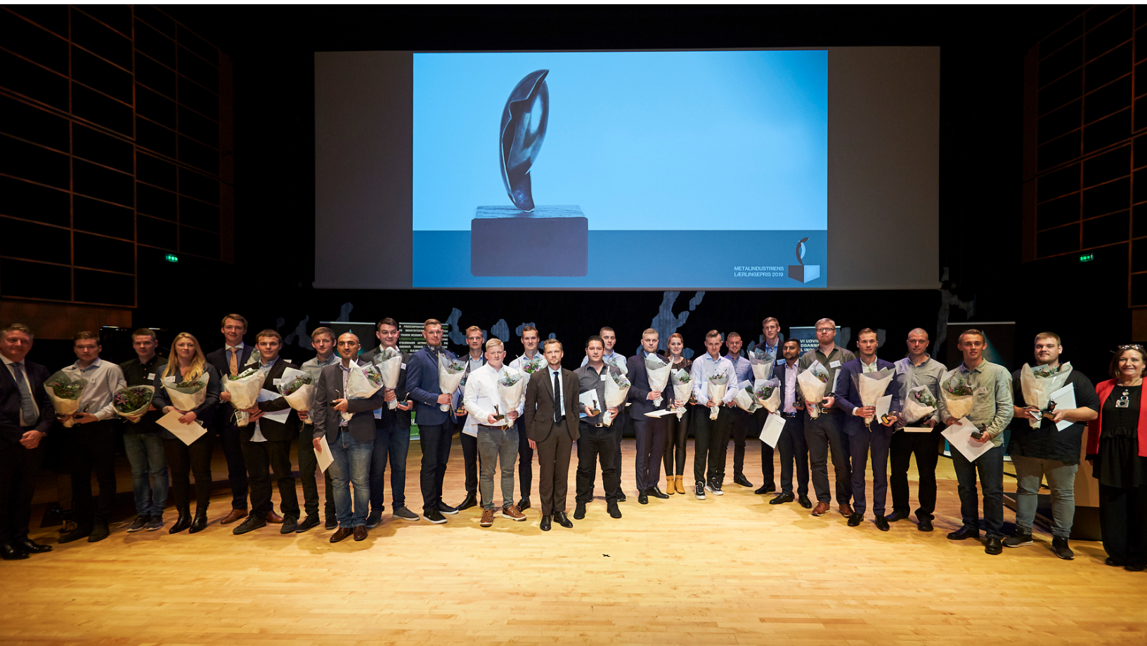
Alle 25 prismodtagere