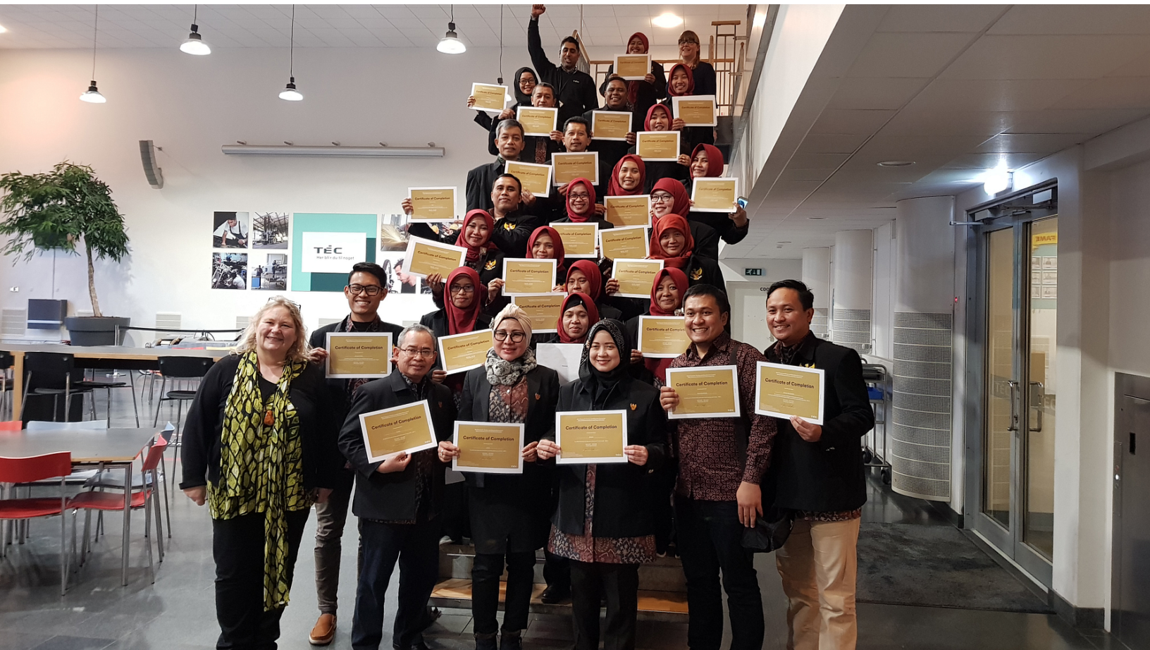
De indonesiske kursister sammen med arrangørerne fra TEC.