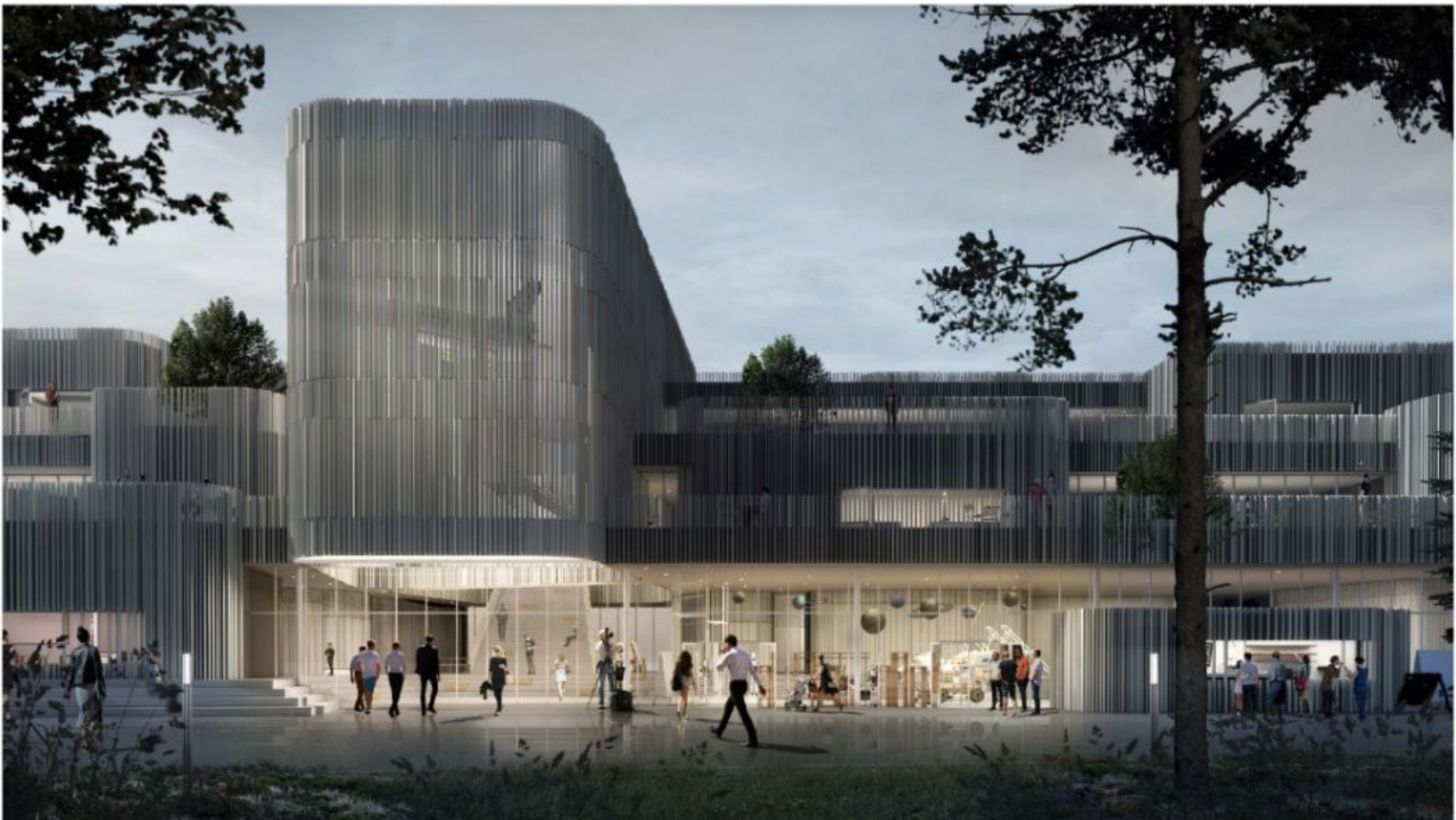
Visualisering af gymnasiets front og hovedindgang - lavet af KANT.