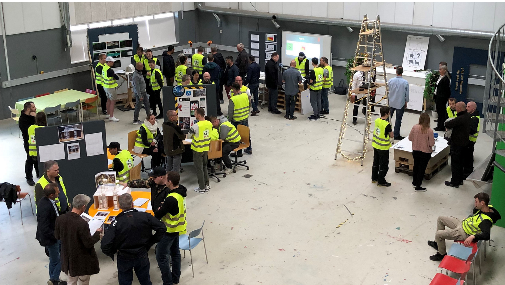
Innovationscamp på transportuddannelserne på TEC.