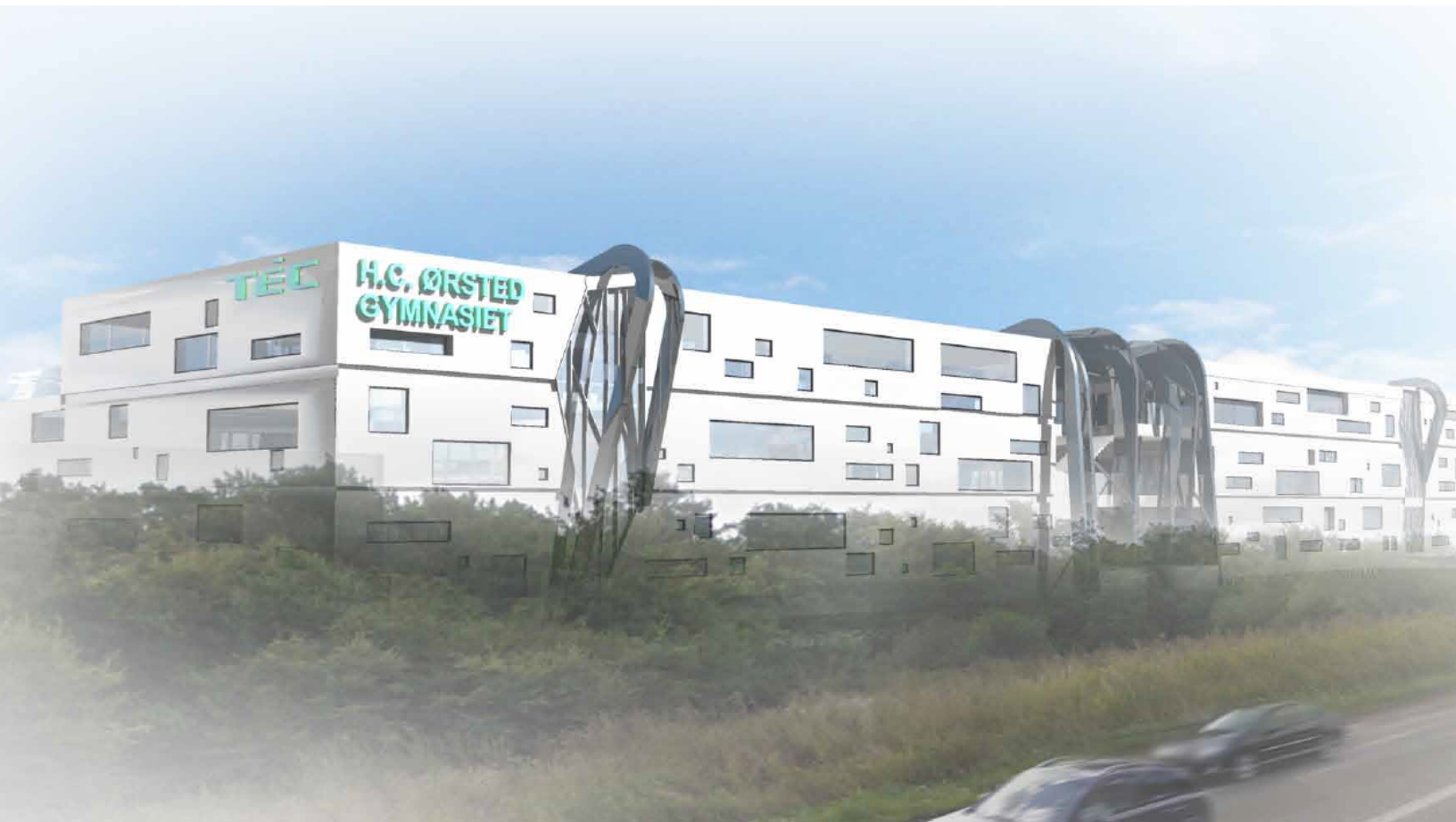
Modeltegning af det nye H.C. Ørsted Gymnasie i Lyngby