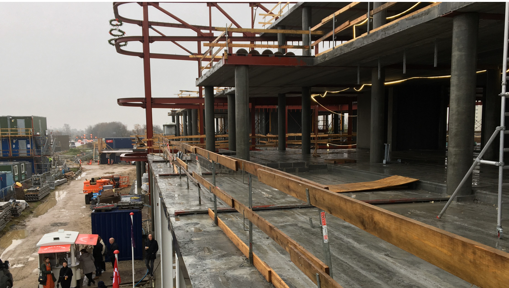
H.C. Ørsted Gymnasiet - den røde stålkonstruktion er den kommende aula.