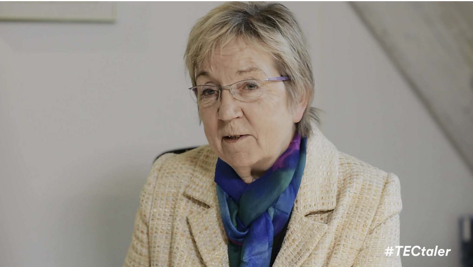
Marianne Jelved, Medlem af Folketinget