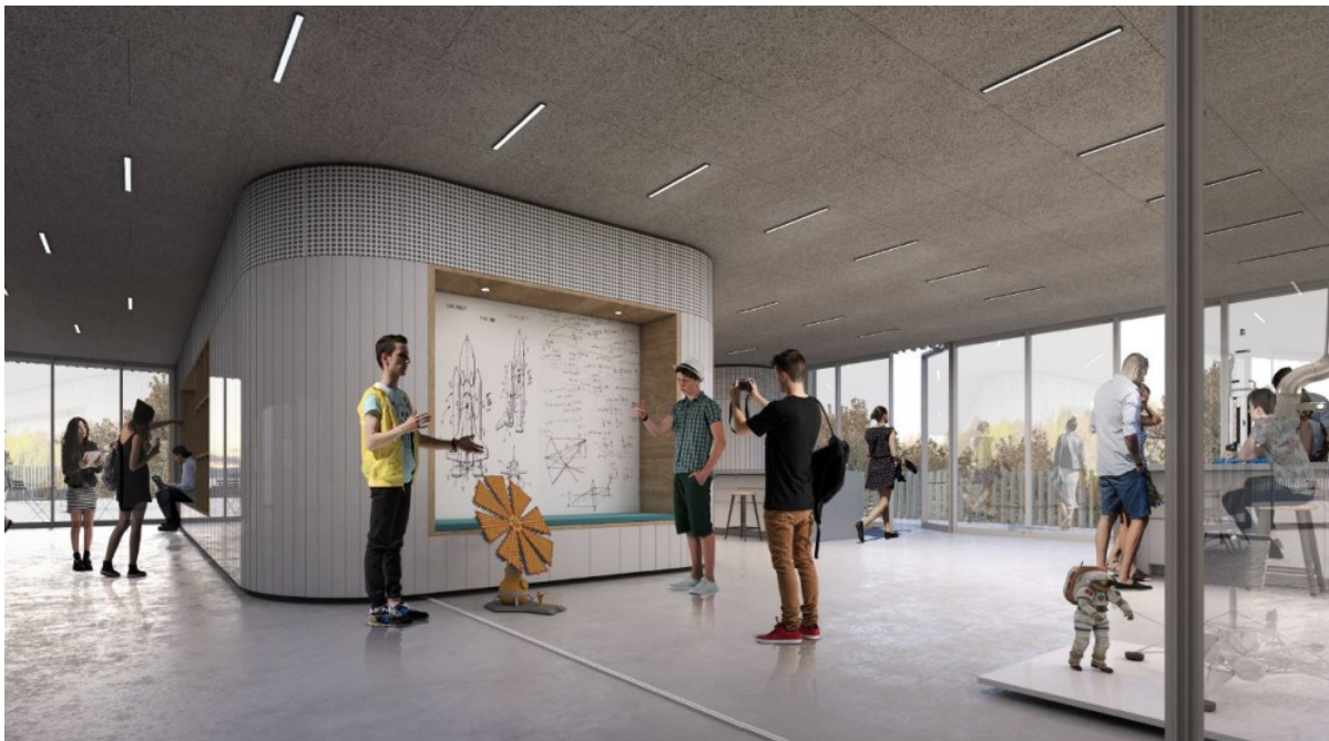
Visualisering af indendørs undervisningsmiljø med spole - lavet af KANT.

De elever, som lige har søgt om optagelse og som starter i 1.g til august, vil blive de første studenter, der dimitterer fra det nye H.C. Ørsted Gymnasie.