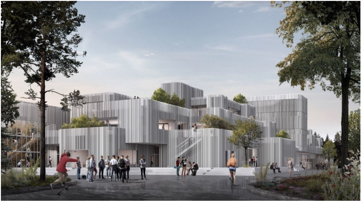
Visualisering af gymnasiet set fra P-pladsen - lavet af KANT.