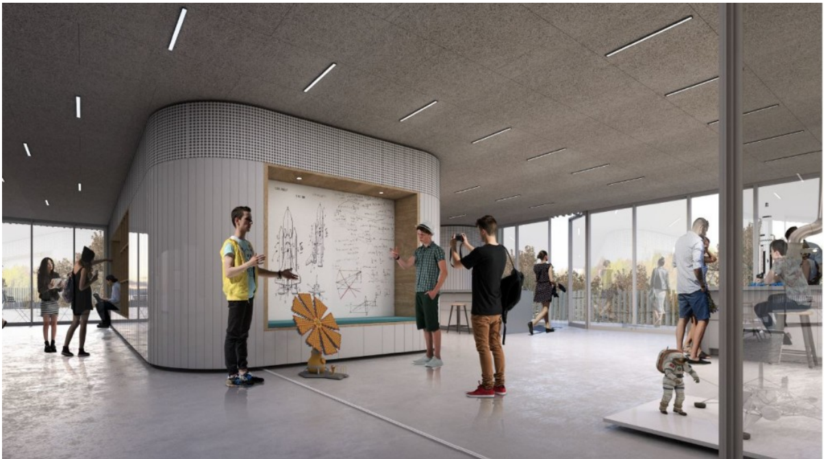
Visualisering af indendørs undervisningsmiljø med spole - lavet af KANT.