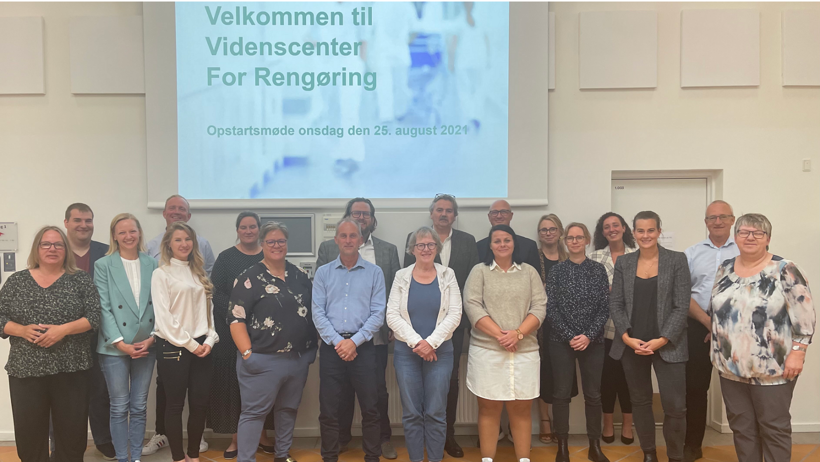
Advisory board for Videnscenter for Rengøring