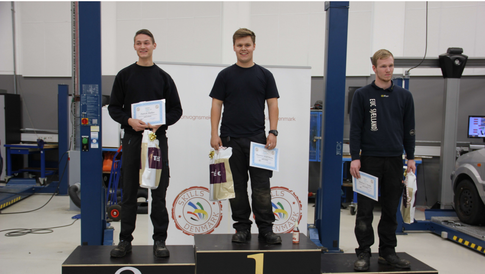
De tre vindere ved det sjællandske regionsmesterskab for personvognsmekanikere.