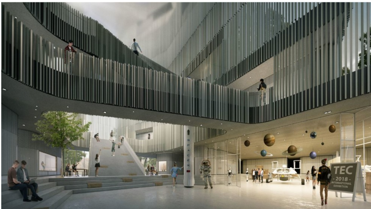
Visualisering af aulaen - lavet af KANT.